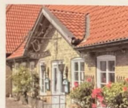
Zwischen Ostsee & Schlei