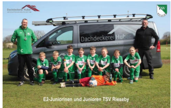
E2-Juniorinnen und Junioren TSV Rieseby